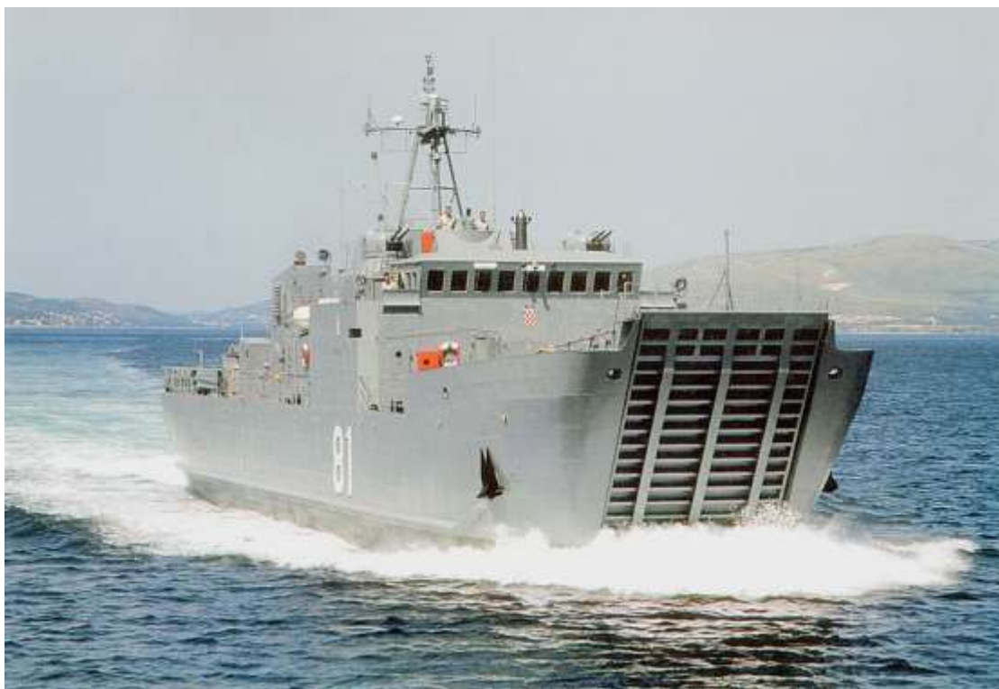
Slika 2 - Desantni brod "Cetina"

Civilni program BSO-a, među ostalim, obuhvaća izgradnju 12 plutajućih platformi za bojanje brodova (1986.–1987.) za sovjetskog naručitelja, dva trajekta duljine 41 m (1997.) i četiri duljine 88 m (2004.–2010.) za Jadroliniju, četiri broda za traganje i spašavanje duljine 17 m (1999.–2002.) i tri duljine 15 m (2004.–2005.) za Ministarstvo pomorstva, prometa i veza RH, istraživački brod Bios-2 (2009.) za Institut za oceanografiju i ribarstvo iz Splita, niz manjih putničkih brodova za krstarenja i dr. Od 2015. na navozima BSO-a izgrađena je luksuzna motorna jahta Katina duljine 60 m, a u novije vrijeme serija Obalnih ophodnih brodova za Hrvatsku ratnu mornaricu.