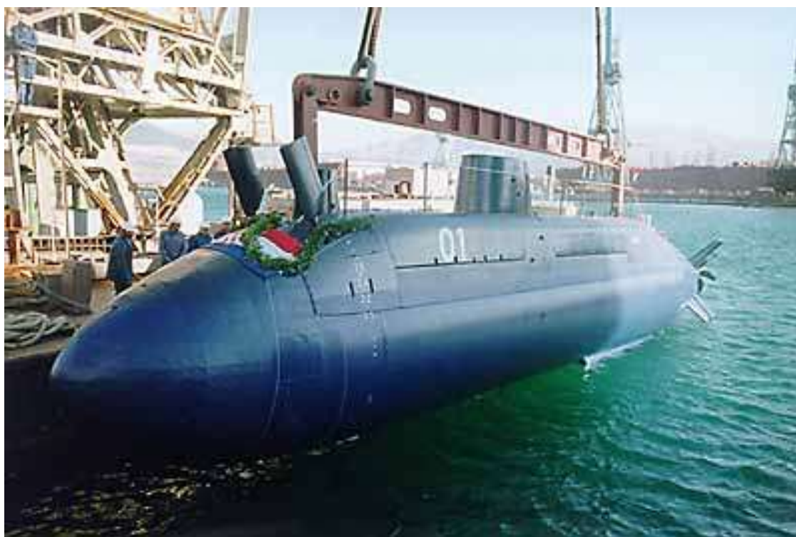
Slika 1 - Podmornica "Velebit"

Na površini od 34.000 m 2 BSO raspolaže proizvodnim kapacitetima za preuzimanje najsloženijih projekata.