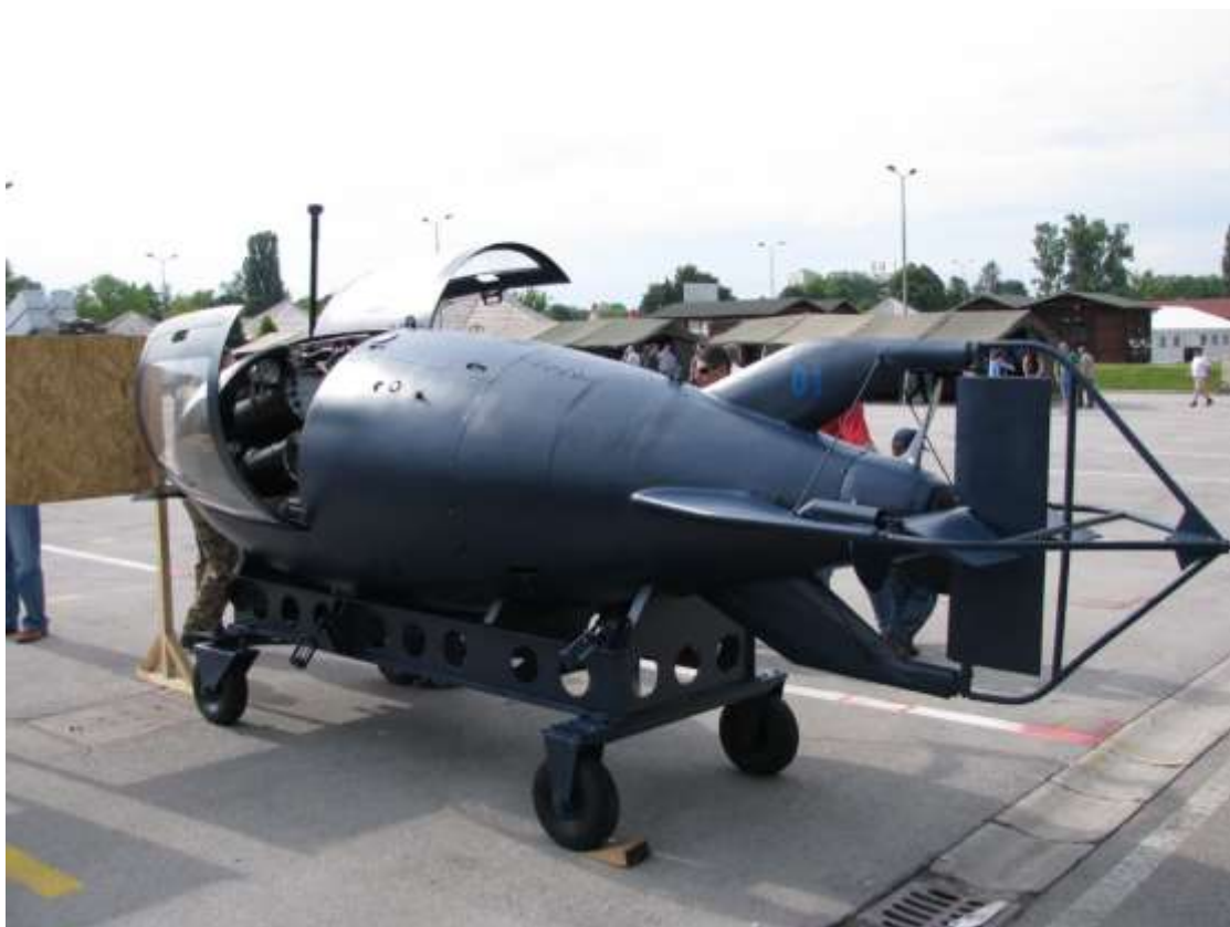
Slika 3 - Ronilica R-2M